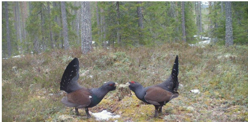
Photo prise le 12 avril 2024 en Norvège avec les pièges photos du plan de renforcement.

L'État autorise par arrêté préfectoral ce projet à titre exploratoire pour une première période de 5 ans.